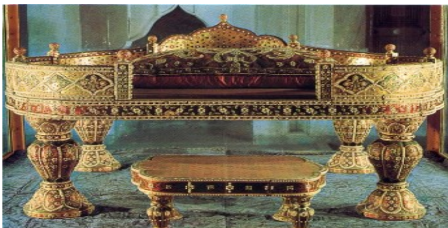
تخت امپراتور سلطان احمد سوم

چینی آلات، چینی کاریها و اشیای عتیقه و خود قصر این قصر اشیایی دارد که انسانها در تمام جهان آرزوی یک بار دیدن آنها را دارند.